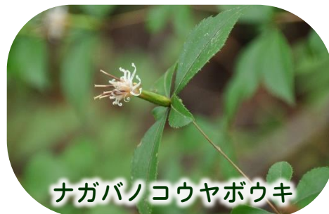
ナガバノコウヤボウキ