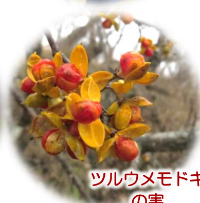
ツルウメモドキ の実