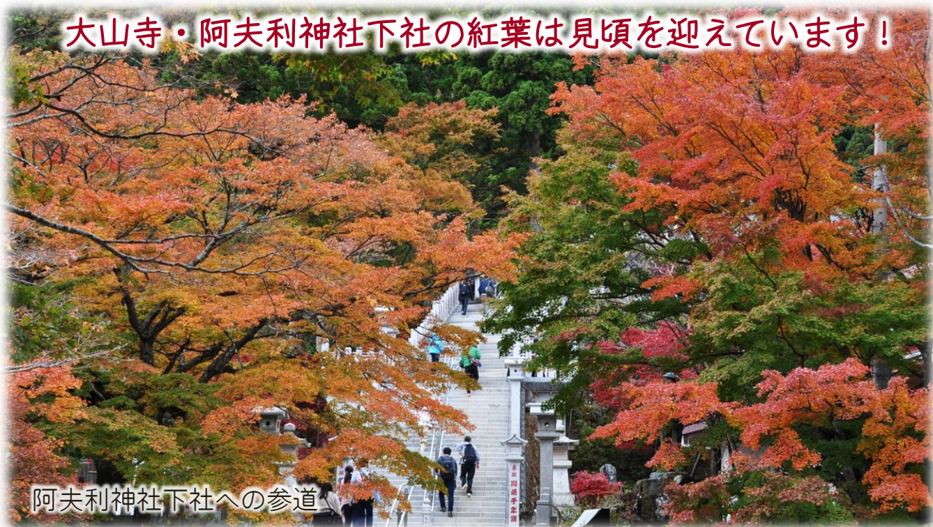
阿夫利神社下社への参道