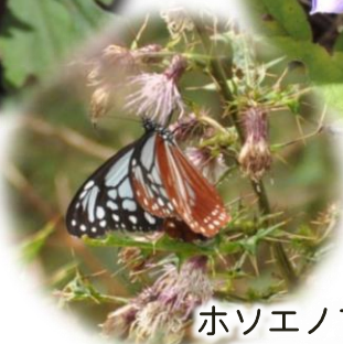
ホソエノアザミと アサギマダラ