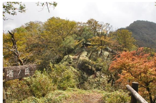
塔ノ岳から日高方面の鞍部