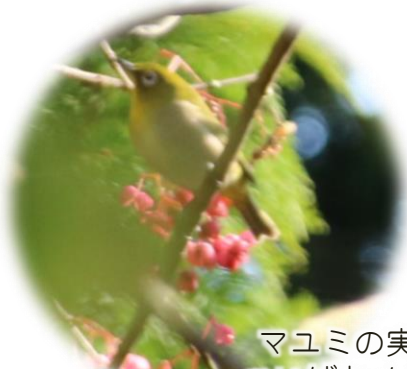
マユミの実を ついでむメジロ