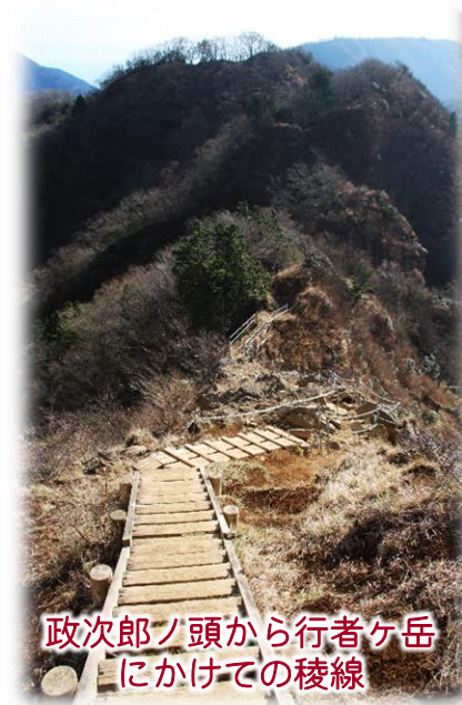
政次郎ノ頭から行者ヶ岳 にかけての稜線