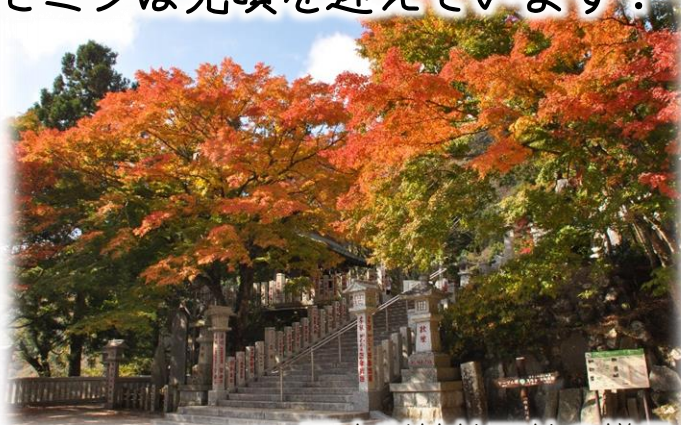
阿夫利神社下社の様子