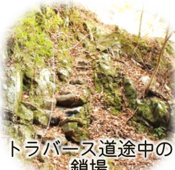
トラバース道途中の 鎖場