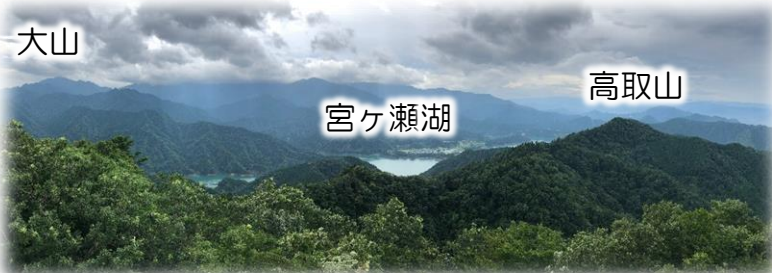
仏果山からの眺め