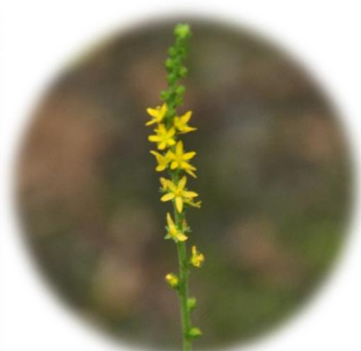
ヒメキンミズヒキ