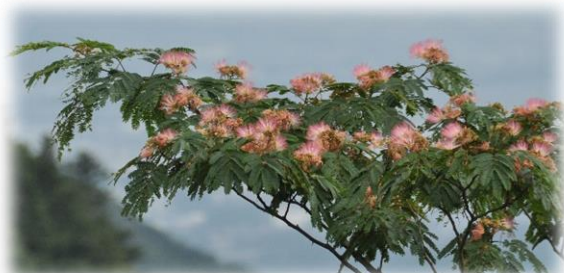
山頂付近で見頃のネムノキ