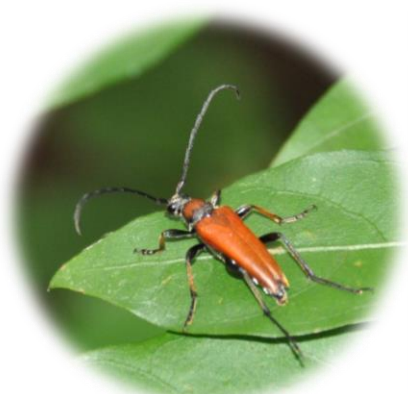
アカハナカミキリ