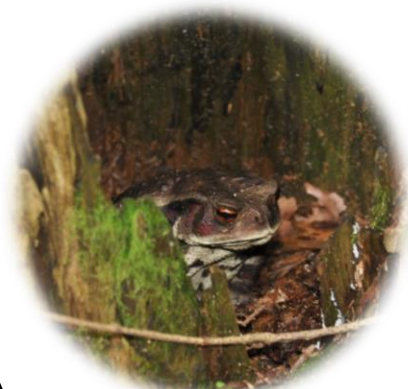
アズマヒキガエル