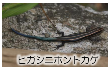
ヒガシニホントカゲ