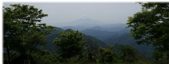
鍋割山山頂から見た富士山