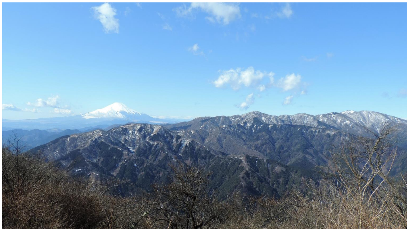
大山山頂の北側からの景色