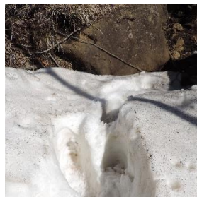
吹溜りでは積雪が 50～60cmの所も