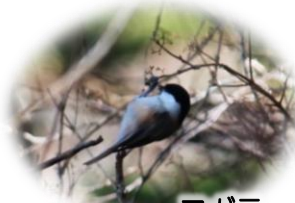
コガラ 野鳥たちの姿も