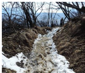
雪がシャーベット状に