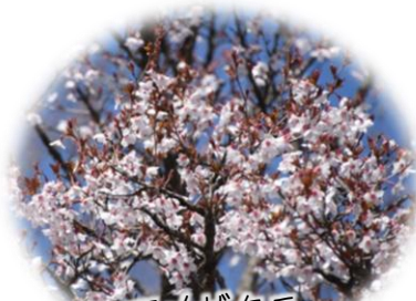
マメザクラ 標高1300m位で見頃