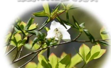
シロヤシオ 標高1050m位で咲き始め