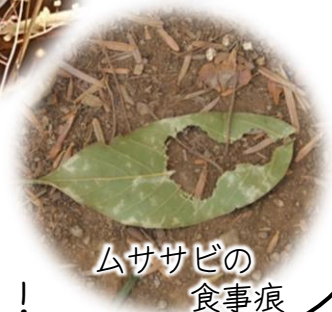
ムササビの 食事痕