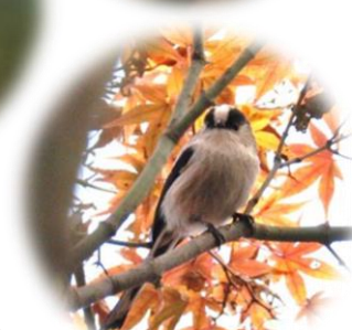
エナガ 紅葉をバックに。