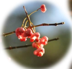
マユミの実 ピンクの果皮も 目立ちます。