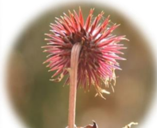
オヤマボクチの後ろ姿 陽に透けて、 赤紫色がきれいです。