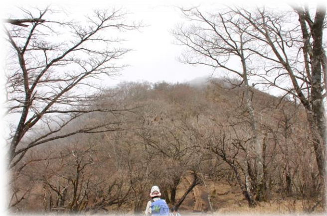
金冷シ～塔ノ岳 ：葉が落ち、初冬の雰囲気です。