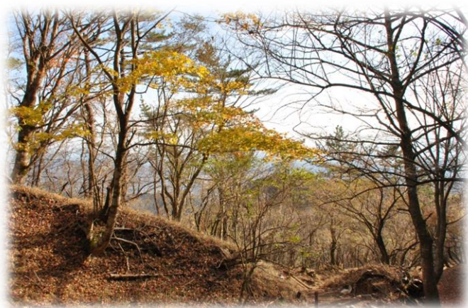
標高1000m付近 ：比較的紅葉の遅いカエデ類が残っています。