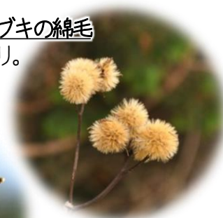
マルバダケブキの綿毛 白いボンボリ。 可愛いです。