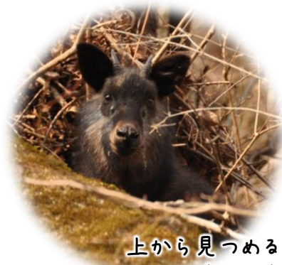
上から見つめる カモシカ