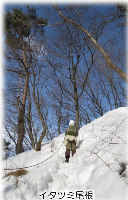
イタツミ尾根 (標高900m付近)