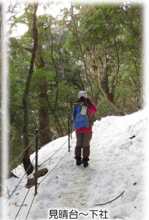
見晴台～下社 (標高760m付近)