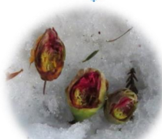
ムササビの食痕 ツバキの花芽