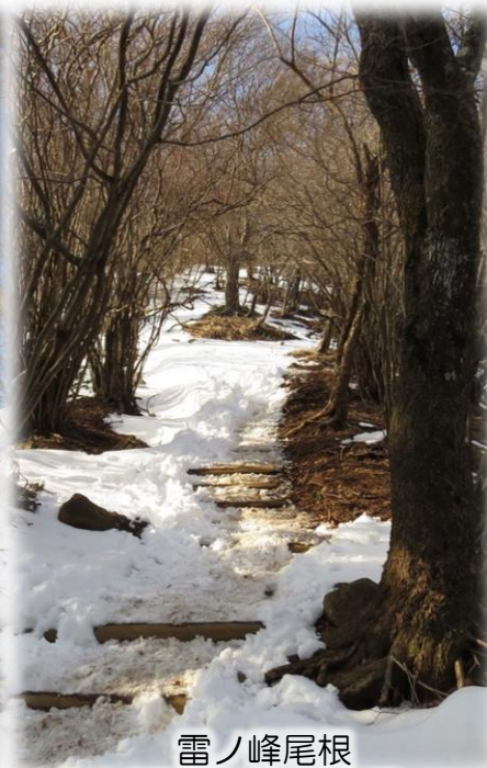
雷ノ峰尾根 (標高950m付近)