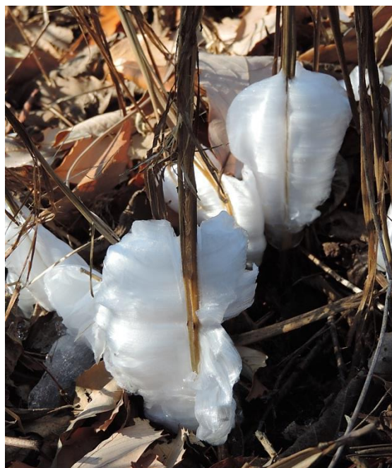
シモバシラ(シソ科)の氷の華 吸い上げた水分が茎から出て凍る。