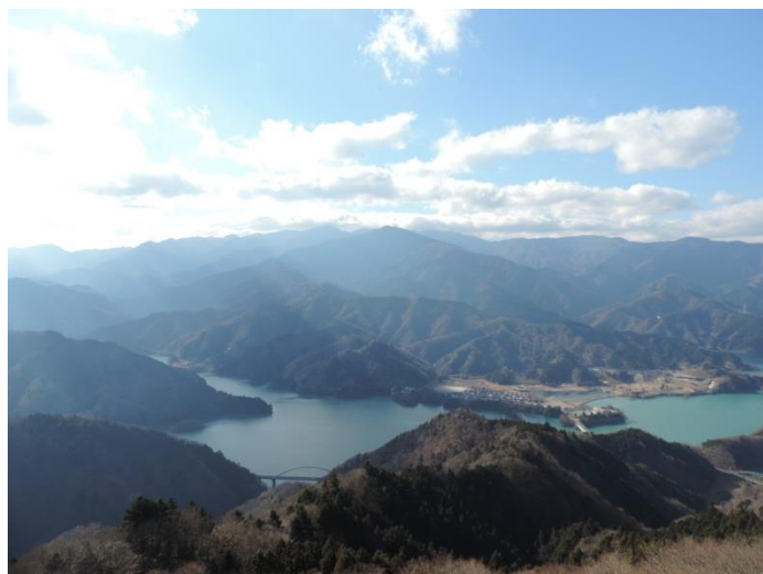
高取山山頂から丹沢方面の眺め。

宮ヶ瀬湖や丹沢の山々を眺めながらの尾根歩き。 そして、この時期ならではの楽しみも待っていました。