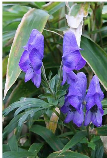
ハコネトリカブト

から11月30日まで開催しています。言葉に毒のあるスタッフはおりませんので、安心してお越しください。(信濃)