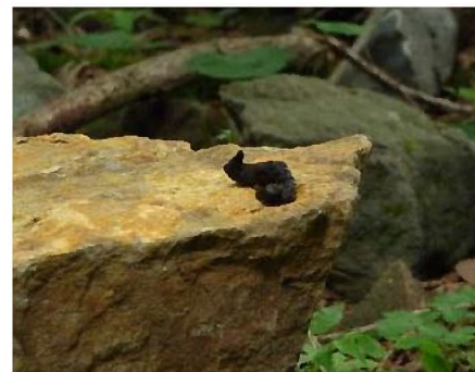
石の上のテンのフン