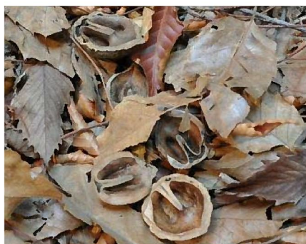
リスに食べられたクルミの殻