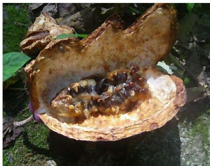
熟したアケビの実

一見ただけでは何もないように思ってしまうかもしれませんが、立ち止まって辺りを見回してみてください。じっくり観察することで、きっと新たな発見がありますよ。(山口)