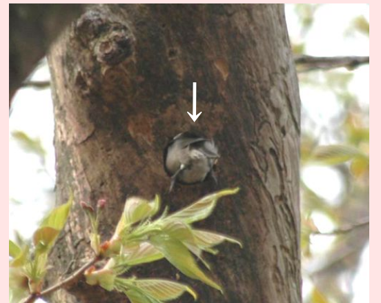
巣穴を掘るコガラ

そうです！今は春。コガラも子育てのための巣作りをしているのです。なんと、この鳥は“枯れ木の幹や枝にくちばしで穴を掘って自力で巣穴を作る”(『山溪カラー名鑑 日本の野鳥』より)のだそうです。でも、出てくる木屑も本当に少なく、そんな小さな嘴で本当にこれを掘ったの？巣穴になるまで掘ることができるの？と思ってしまう。