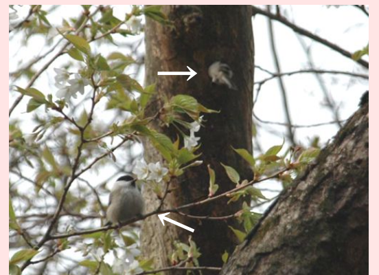
コガラの番(つがい)

4月の上旬に大倉尾根を登っている途中、ふと頭の上から「コココココ…」と木をつつく小さな音が聞こえ足を止めました。なんの音だろうと探してみるとある枯れ枝に動く姿がありました。コガラです。一心不乱に枯れ枝に開いた穴に顔を入れたり出したり…。よく見ていると、顔を穴の中に入れておきには「コココココ」と音が聞こえ、出てくるときには、一緒に木屑が出てくるのです。