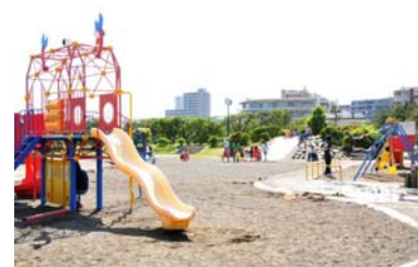
子供に人気のある遊戯広場