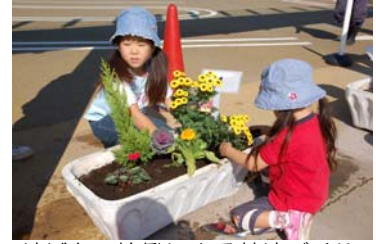
地域との協働による花壇づくり