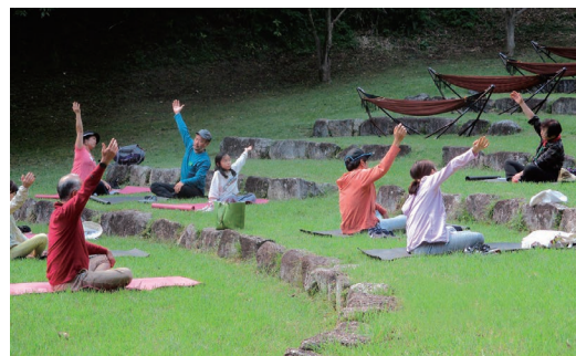
七沢森林公園森林セラピー体験

七沢森林公園やいせはら塔の山緑地公園では50周年記念のイベントを実施し、緑の健康効果を活かした森林セラピーやハイキングなどの健康増進の取組を行いました。