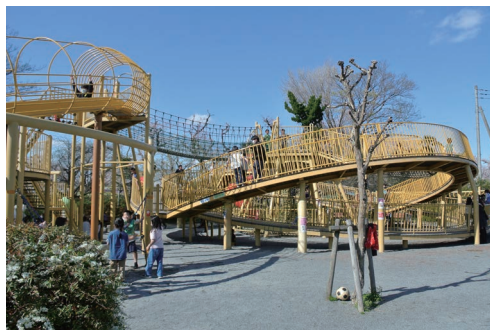
ふれあい広場 大型遊具