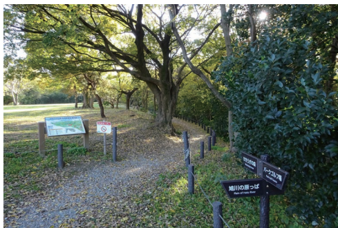
2020年4月には、河畔林等の河川環境が学べる自然観察園がオープンしました

園内には、見晴らしのよい「夕焼けの丘」、子ども達に大人気の大型遊具や噴水のある「ふれあい広場」、鳩川沿いには桜並木の美しい遊歩道がある他、軟式野球やソフトボール・サッカーなどが行えるグラウンドと、どなたでも楽しめるパークゴルフ場を備えています。パークセンターは太陽光発電や雨水を再利用する機能を持った環境共生型の施設です。管理事務所のほか、どなたでもご利用いただける多目的スペースや授乳室があります。パークゴルフの利用受付も行っています。