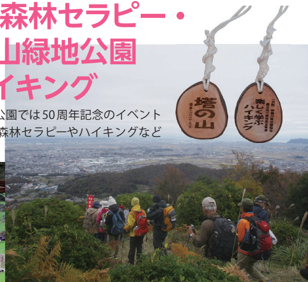
いせはら塔の山緑地公園楽しく学ぶハイキング

2024年度も引き続き、公園の魅力向上や利用者の健康増進等を促進する取組み・イベントを行ってまいります。