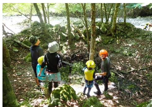
ミニ教室「ファミリーキッズ河原で自然体験」 (西丹沢ビジターセンター)