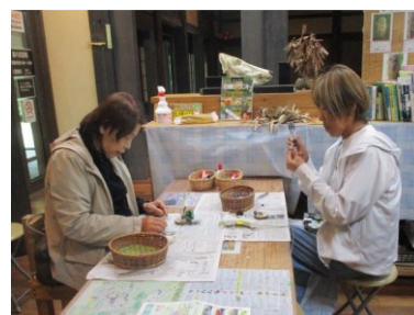
クラフト体験 (七沢森林公園)