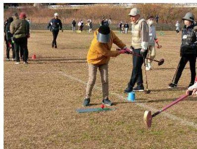
グラウンドゴルフ大会 (境川遊水地公園)