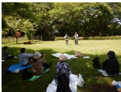
森林セラピー体験 (座間谷戸山公園)