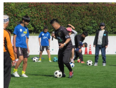
サッカー教室 (保土ケ谷公園)