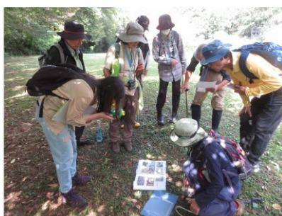
自然観察会 (津久井湖城山公園)