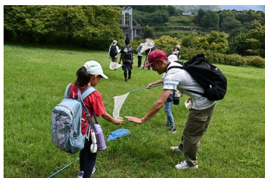
観察会「たての先生と行く！自然観察の森」 (秦野ビジターセンター)