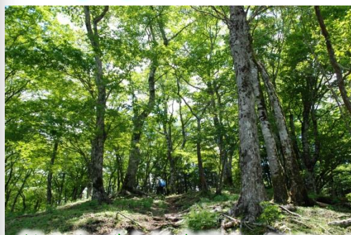
静かなブナ林を進む(鍋割山手前)