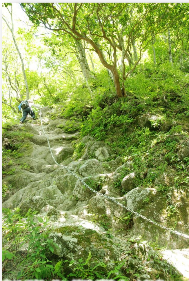
痩せ尾根・長い鎖場が続く、上級者コース