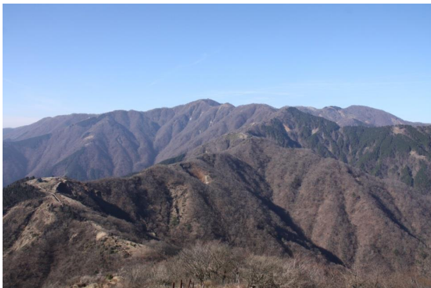
紅葉が終わり冬景色が広がる (三ノ塔山頂付近から)