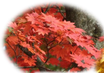
コハウチワカエデ