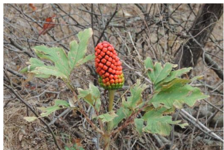
テンナンショウの仲間の実