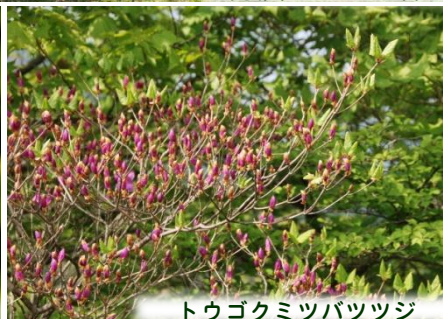
トウゴクミツバツツジ