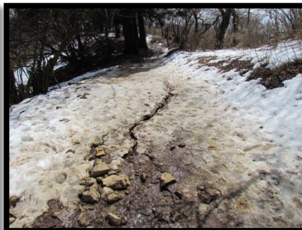
1000m付近から上は、 雪解けでシャーベット状