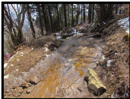
1000m以下や日向は、 ぬかるんで田んぼ状態