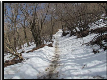
イタツミ尾根(ヤビツ峠～大山) 1000m付近から積雪7～10cm