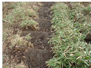
霜が解けた登山道はぬかるんでいます。