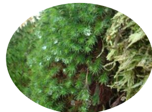
しずくも凍っています。