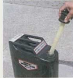
②空気が全て抜けたら ノズルを本体から分離。