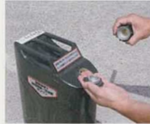
③ネジ部と平キャップを ここで分離する。