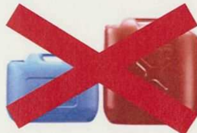
ガソリンの貯蔵に適さない容器の例 (樹脂製容器は火災危険性が高い)