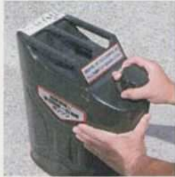
①元のネジ部を少し緩め 缶内の圧縮空気を抜く。