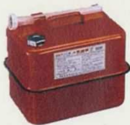
ガソリンの貯蔵に適した容器の例 (金属製容器であることが必要)

携行缶の種類によって、圧力調整ネジが付いているものがあります。作業手順が異なる場合があります。必ず取扱説明書等で確認しましょう。