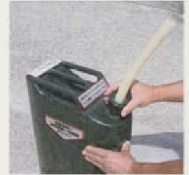
④ノズルを接続する。