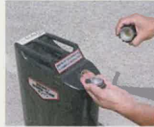
③ネジ部と平キャップを ここで分離する。