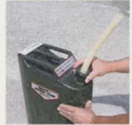
④ノズルを接続する。