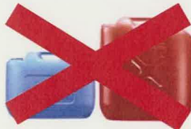
ガソリンの貯蔵に適さない容器の例 (樹脂製容器は火災危険性が高い)