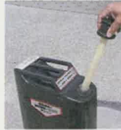
②空気が全て抜けたら ノズルを本体から分離。