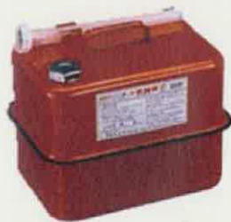
ガソリンの貯蔵に適した容器の例 (金属製容器であることが必要)

携行缶の種類によって、圧力調整ネジが付いているものがあります。作業手順が異なる場合があります。必ず取扱説明書等で確認しましょう。