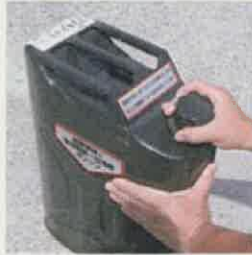
①元のネジ部を少し緩め 缶内の圧縮空気を抜く。