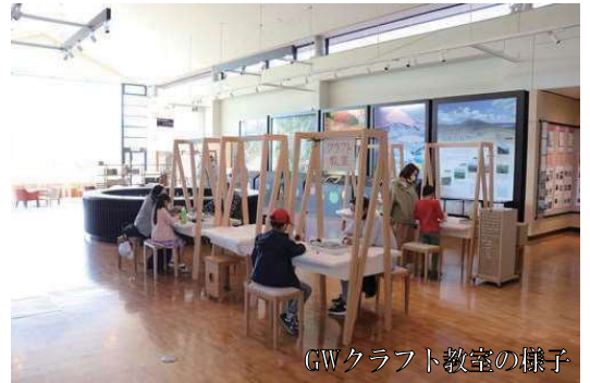
GWクラフト教室の様子