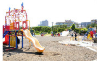
子供に人気のある遊戯広場