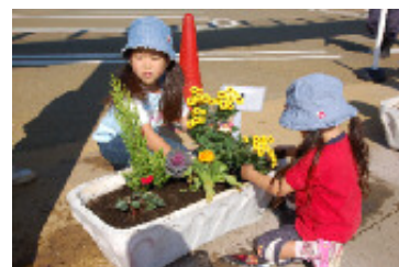
地域との協働による花壇づくり