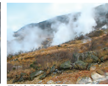
アセビ、スキの草原