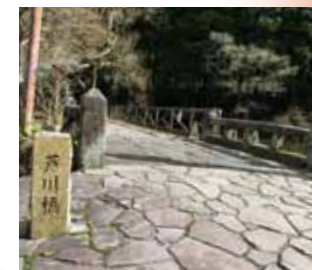
芦川橋 (かながわの橋100選)