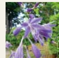
ギボウシ (7月下旬～8月上旬)