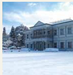
雪の日の湖畔展望館（冬）