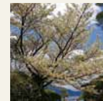
オオシマザクラ (4月下旬～5月上旬)