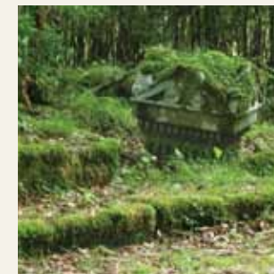
旧山上門の門柱頭