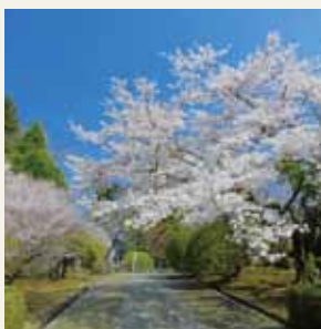
山上門跡と満開の桜（春）

湖面に映る富士山や離宮時代の面影を残す生垣、大木の木立などが四季折々の姿を見せてくれます。1時間ほどかけて園内を回ってみませんか。