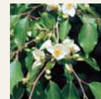
ヒメジャラ (7月上旬)