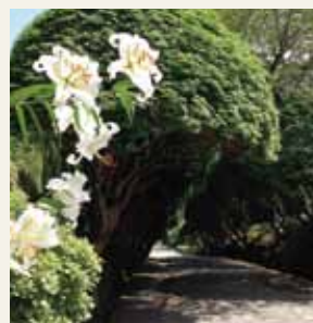
中央園路とヤマユリ（夏）