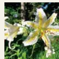
ヤマユリ (7月下旬～8月上旬)