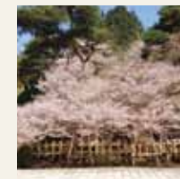
マメザクラ (4月下旬)