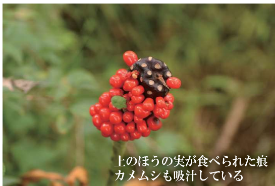
上のほうの実が食べられた痕 カメムシも吸汁している