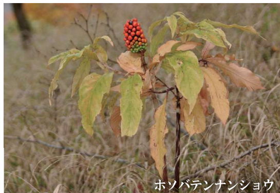
ホソバテンナンショウ