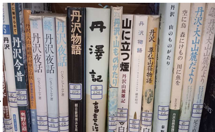
丹沢の地名に関連する西丹沢ビジターセンターの蔵書