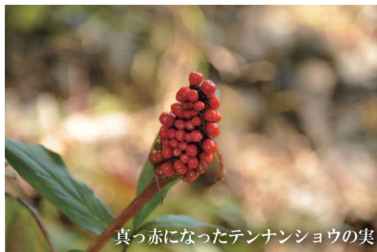
真っ赤になったテンナンショウの実