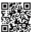
箱根ビジターセンター

箱根ビジターセンター、秦野ビジターセンター、西丹沢ビジターセンターのFacebookページ公開中! QRコードから最新の情報をご覧ください。