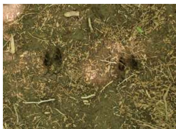
ニホンジカの足跡