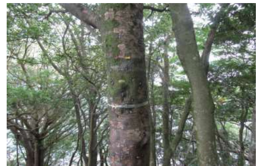
ナラ枯れに耐えたアカガシ