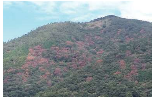
明星ヶ岳のナラ枯れ