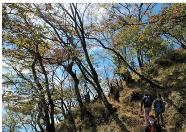
丹沢でも一番人気の山、大山の登山道

気温や湿度が低下し、登山に心地良い季節がやってきました。紅葉や色づく木の実などを眺められるのは秋の楽しみの一つです。一方、日没が早くなったり、落ち葉で登山道が分かりにくくなるといったリスクが伴うのも秋山登山の特徴です。秋から冬にかけては、道迷いや下山時の転倒・滑落などの遭難が増える傾向にありますので、十分ご注意ください。