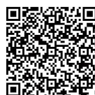
秦野ビジターセンター