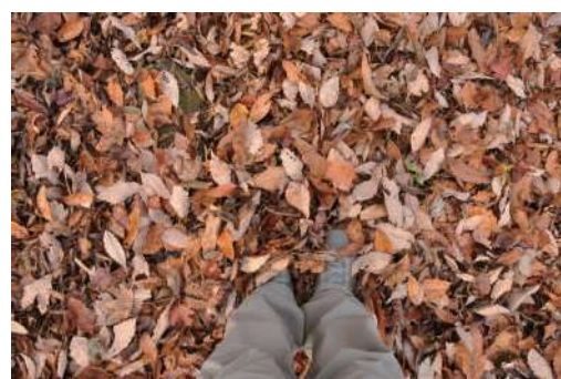
落ち葉で埋もれた登山道