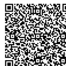
西丹沢ビジターセンター