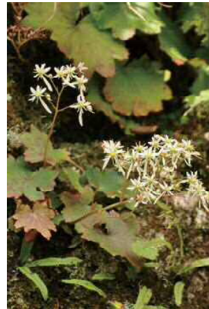
ダイヤモンドソウ