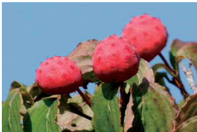
ヤマボウシの実 綺麗な色を見られるかは自然次第です

様子を確認しながら散策に来て下さい。美味しい・楽しい・美しい箱根の秋をご案内出来ることを祈っています。(築紫)