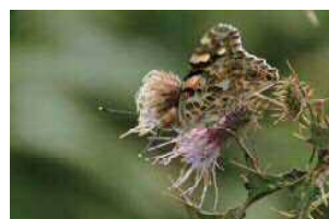
アザミの蜜を吸うヒメアカタテハ