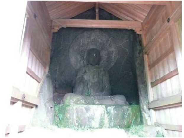
優しい顔の六道地蔵さま

信仰の霊地になったと考えられています。像高3.5mに及ぶ六道地蔵（地蔵菩薩坐像）を中心に二十五菩薩（阿弥陀如来立像他25体）等、多くの石仏や石塔は「元箱根石仏・石塔群」として国の史跡に指定され、保存のための整備も行われています。