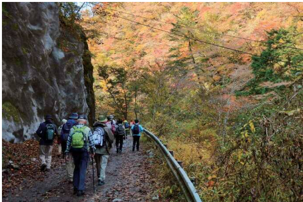
多くのハイカーが林道を歩いている

登山をしていると危ない目に遭うことがあります。濡れた岩が滑ったり、沢沿いで登山道を見失ったり、一日に何度か「ヒヤリ」とします。この小さな危険を経験として蓄積し、危険を感知するセンサーを鍛えることは、安全につながる大切なことです。