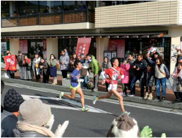
必死の走りに声援を送る人々

箱根のお正月といえば何といても「箱根駅伝」です。今年で93回目となる箱根駅伝（東京箱根間往復大学駅伝競走）は、東京～箱根間を往路5区間（107.5km）、復路5区間（109.6km）の合計10区間（217.1km）で競う学生長距離界最大の駅伝競走です。厳しい寒さの中、毎年大勢の人が沿道に立って選手に熱い声援を送っています。