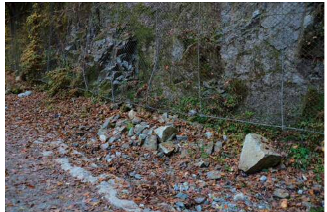
新しい落石が林道にある

昨年の秋から「ユーシンプルー」を眺めに玄倉林道を歩くハイカーが急に増えました。青くて透明感のあるきれいな写真が注目され、インターネットで拡散されて人気が出ました。