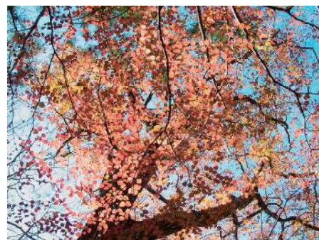
堂ヶ島溪谷の紅葉

は宮城野から宮ノ下まで尾根沿いや溪谷沿いをなだらかに下る変化に富んだコースです。アカシデやヤマボウシ、ミズナラ、カエデ等の大木が多く、登山道から見上げると色とりどりの葉がお日様に照らされてとても綺麗です。12月の初め、よく晴れた日にお出かけ下さい。（石原）