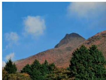
箱根ビジターセンターから望む 落葉の冠ヶ岳

ところが、今年は大涌谷の噴気の影響で神山周辺の木々は色付く前に葉を落としてしまいました。ビジターセンターから見る箱根のクマさん（冠ヶ岳）は、薄茶色でカサカサした感じがします。