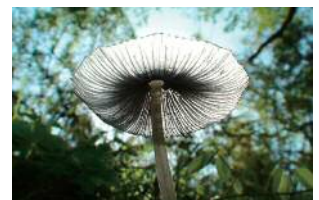
ヒトヨタケの仲間(下から)