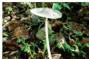
ヒトヨタケの仲間(横から)