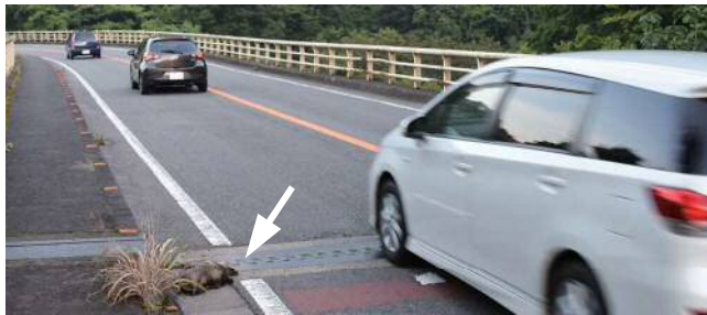
動物の交通事故現場