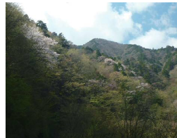
斜面に広がる桜の花