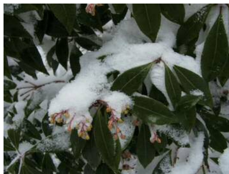
雪をかぶるアセビのつぼみ