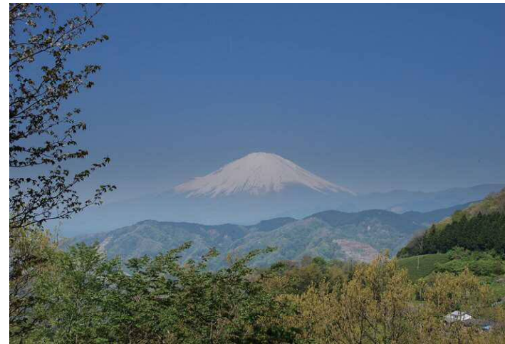
都夫良野付近からの富士山

林道を横断すると、コナラやクヌギなどの明るい広葉樹のつづら折りの道になります。道端にはタチツボスミレやオオイヌノフグリなどが咲いていて、目を楽しませてくれます。野鳥の鳴き声も多くなります。