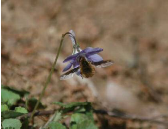
タチツボスミレとピロウドツリアブ

そして、その花々にいち早く訪れる昆虫がいます。停止飛行をしながら長い口(口吻)で蜜を吸うピロウドツリアブです。アブの仲間ですが、毛におおわれた丸い体は愛嬌があって