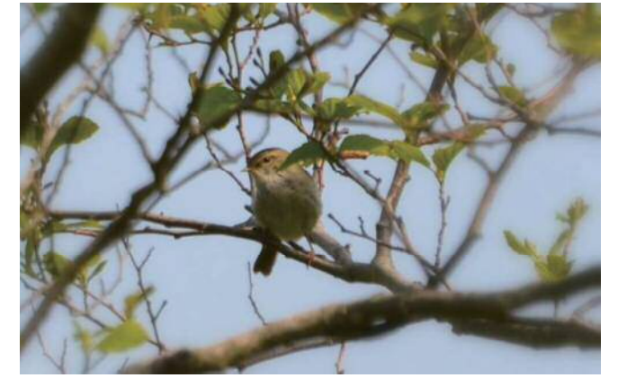
山頂付近で鳴いていたウグイス