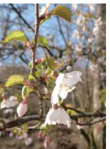
可憐に咲くマメザクラ

5月上旬になると、丹沢の稜線で桜の花の見ごろを迎えます。桜は季節の移り変わりを感じさせてくれます。桜が咲き始めるのが待ち遠しいです。(倉持)