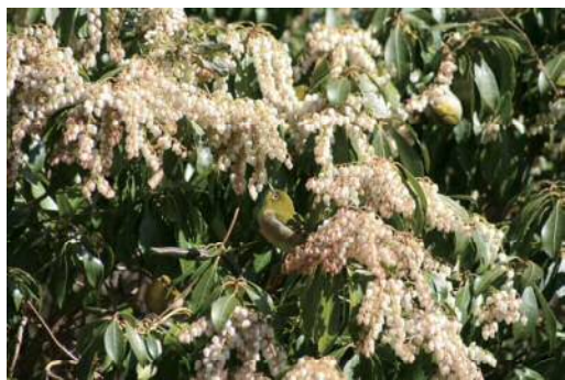
アセビの蜜を吸うメジロ