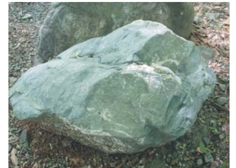
これが枕状溶岩。丹沢で一番古い地層です。