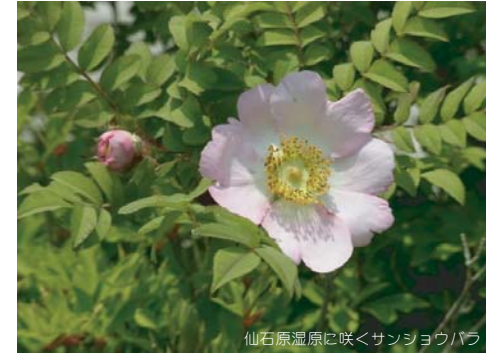
仙石原湿原に咲くサンショウバラ

富士箱根地域特産で、箱根に多産するサンショウバラも、花付きがよく見応えがありました。ビジターセンターのある仙石原周辺では、6月中旬が見頃でしたが、駒ヶ岳山頂や外輪山の稜線沿い、精進ヶ池周辺はまだ蕾で、見頃は7月、梅雨明けの頃になりそうです。