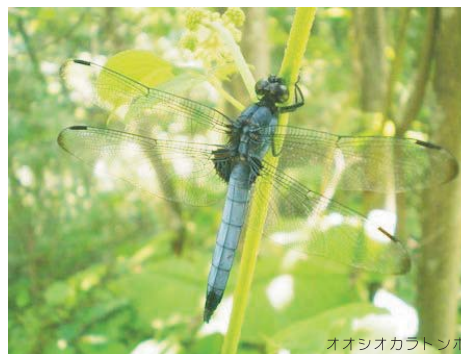
オオシオカフトンボ