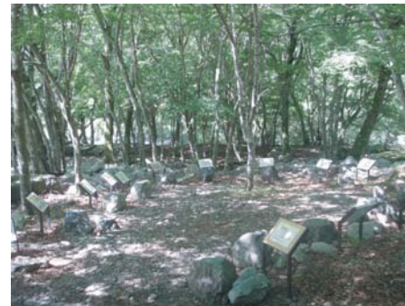
野外岩石展示 石にもいろいろあります。

西丹沢にお越しの際は、展示を通じて丹沢の遙かな歴史に思いを寄せてみてはいかがでしょうか？