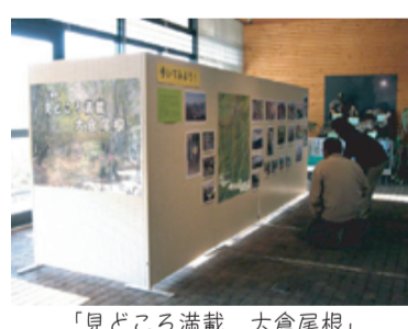
「見どころ満載 大倉尾根」

企画展「見どころ満載 大倉尾根」 表丹沢の登山口である秦野ビジターセンターから塔ノ岳標高一四九一メートルへ向かう大倉尾根は、毎年たくさんの方々が賑わう人気のコースです。企画展では、そんな大倉尾根の情報をお届けします。