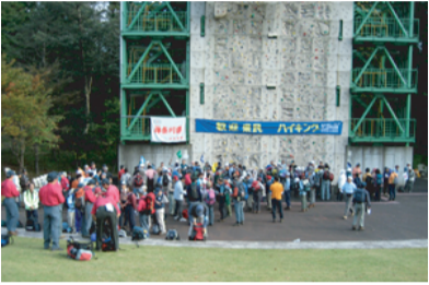
県民ハイクの様子

今月は、館内で丹沢大山総合調査報告のパネル展示を行い、来館者に丹沢の現状と再生について理解を深めていただきました。