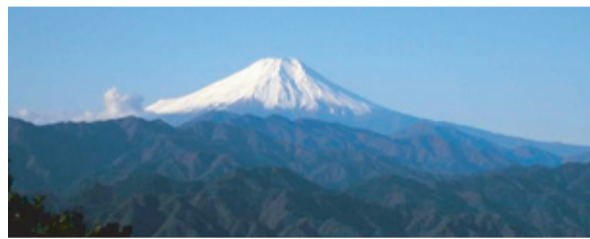
山頂から望む富士山