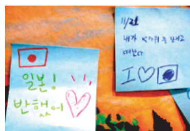
ハンデル語の宝物も...

「みんなで作ろう! ビジターセンター周辺や登山道でみつけた(お宝)をイラストに描いて地図にはっていただくコーナーです。」