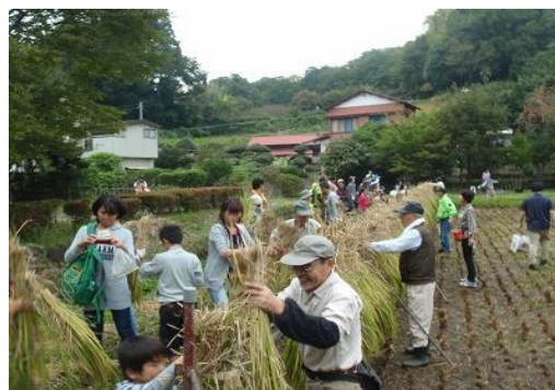
親子で米作り隊 (座間谷戸山公園)