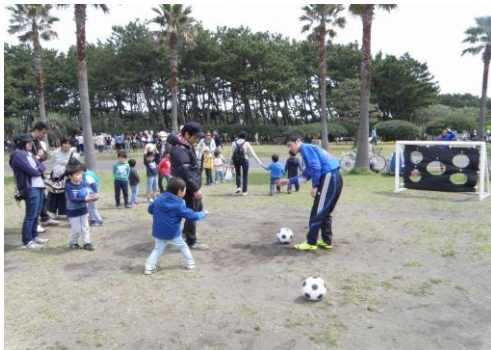
かいひん FRIENDS スポーツ体験 サッカーキックターゲット (辻堂海滨公園)