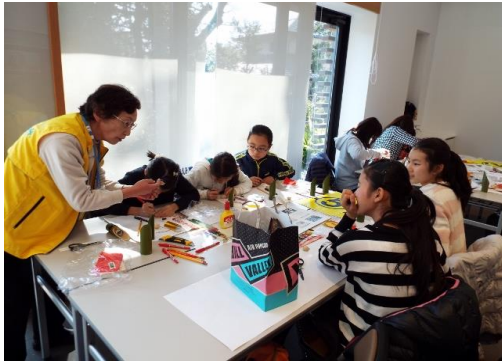
竹細工教室 竹deおひなさま (大磯城山公園)