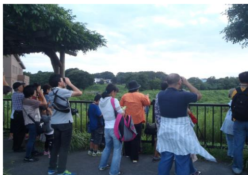
ツバメのねぐら入り観察会 (境川遊水地公園)