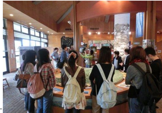
団体対応 大学生を対象としたレクチャー (秦野 VC)