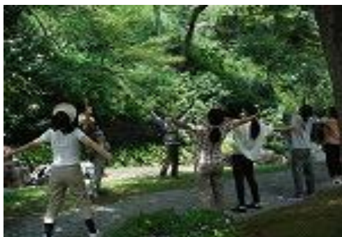
森林セラピー体験ウォーク (七沢森林公園)