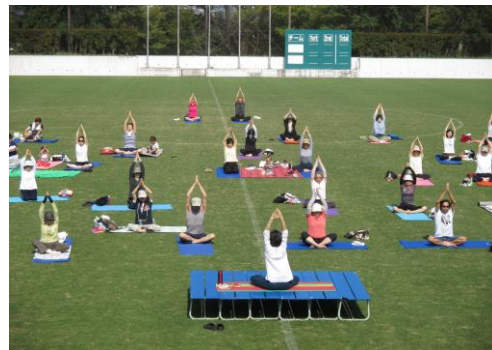
芝生いきいきヨガ教室 (保土ヶ谷公園)