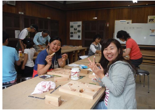
アトリエ講座 時計作り (七沢森林公園)