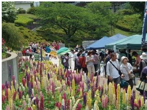
ルピナスまつり (津久井湖城山公園)