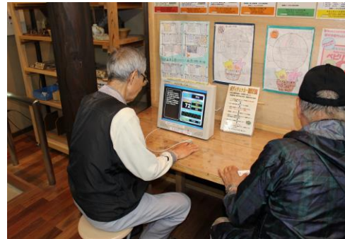
ボディチェッカーによる森林セラピー効果測定 (七沢森林公園)