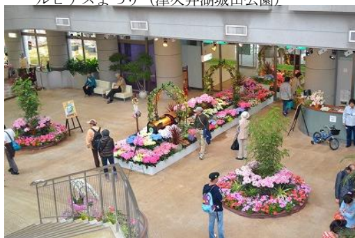
スプリングフラワーフェスティバル (相模原公園)