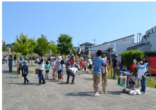
春の里山公園まつり (茅ヶ崎里山公園)