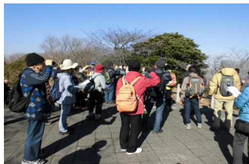
冬のバードウォッチング (塚山公園)