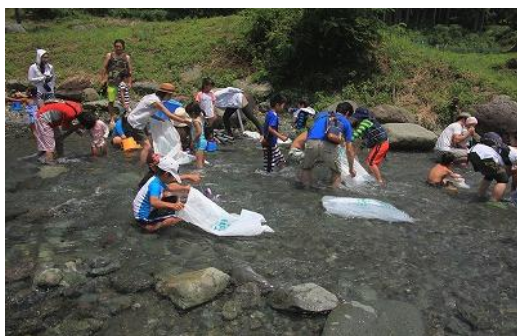
夏の川遊び体験 (秦野戸川公園)