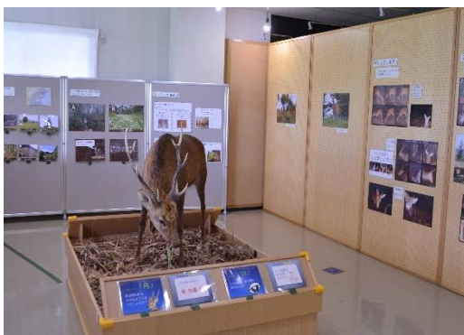
企画展「教えてシカ博士」 (宮ヶ瀬 VC)