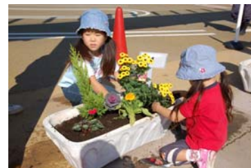
地域との協働による花壇づくり